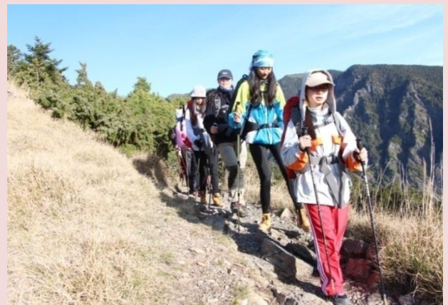
翻山越嶺克服困難，展現大華精神— 做高山上大樹，不做溫室小花