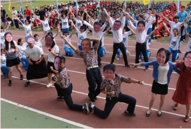
二勤令人驚豔的創意進場

學校鼓勵學生創新與思考，透過運動會創意進場、園遊會及班際運動競賽，培養學生團隊合作與解決問題之能力，辦理學生才藝表演，落實多元發展，提供學生機會表現自我，建立信心。