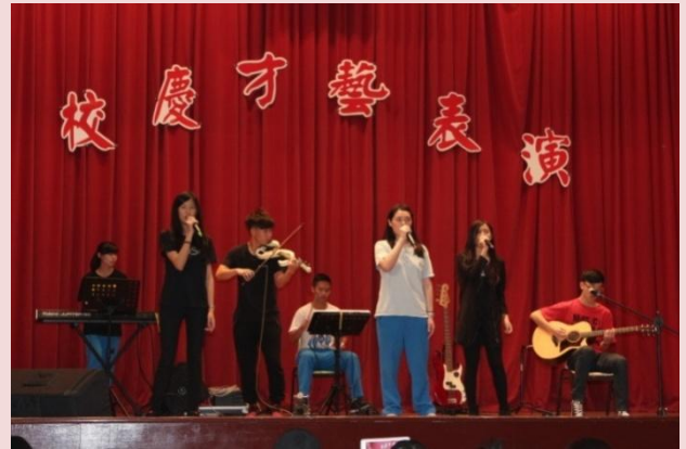
校慶才藝表演，展現學生多樣才藝