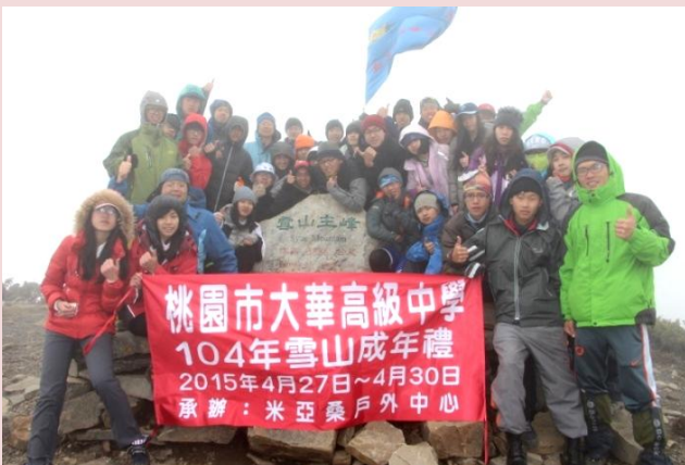
師生成功攻頂，留下重要的一刻

雪山成年禮是大華中學高二學生的傳統，透過深具挑戰的登山課程設計活動，除了增進學生帶得走的能力，凝聚了學生共同迎戰學測的向心力，更增進了親子之間的感情，是一舉數得的活動，學校累積了多年的探索教育活動辦理經驗，也努力創新每年的活動內容，期能給予學生在中學教育的階段，精彩而具意義的生命教育。